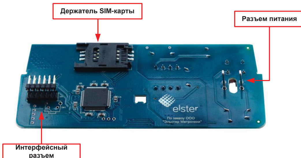
Рисунок 2 – Внешний вид модема (вид снизу)