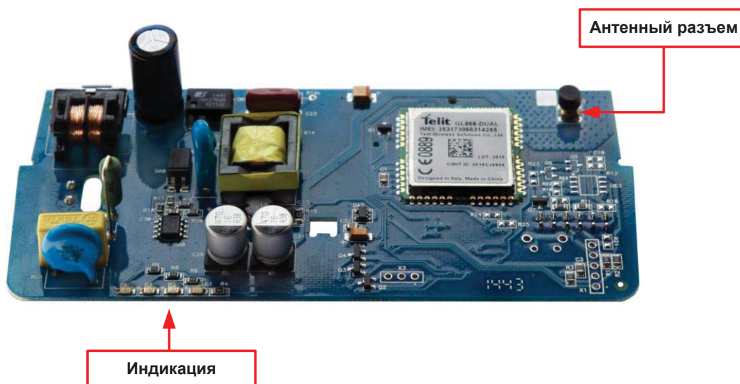
Рисунок 1 – Внешний вид модема (вид сверху)